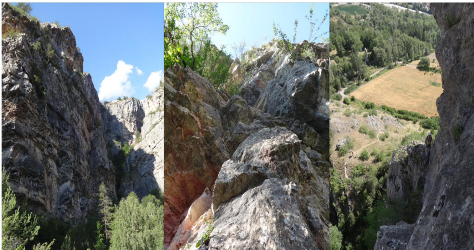
Voie très à gauche « Gorge profonde »

Matériel : 11 dégaines, rappel 2x45m, anneaux de relais, casque.