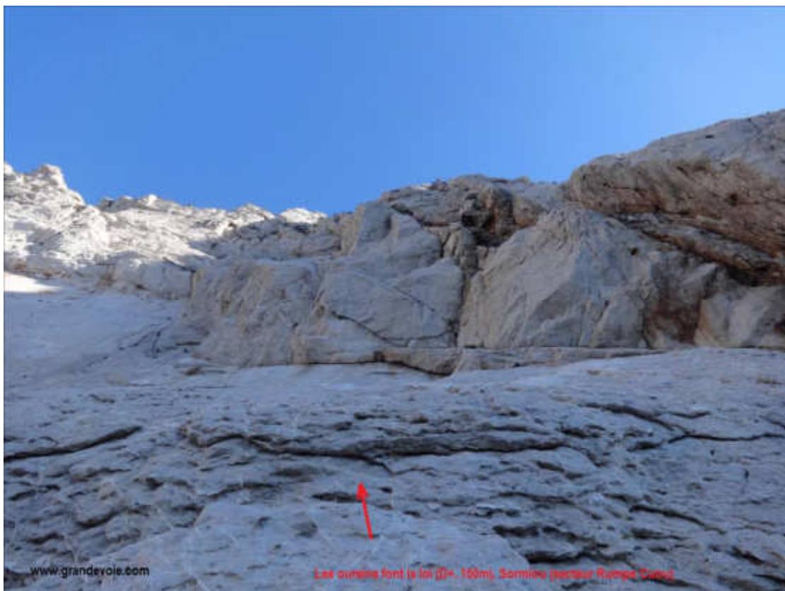
Longueurs L1 et L2

Descente (20 mn) : en allant à gauche (Ouest), on gagne facilement la brèche de l'approche, puis on redescend prudemment vers la plage de Sormiou.